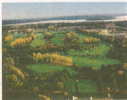
Aller Anfang. Das britische Militär baute in Gatow die ersten neun Löcher.